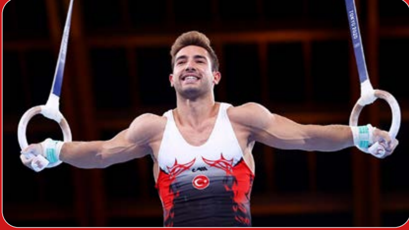
Artistik Cimnastik Dünya Şampiyonası Halka Dalı Dünya Şampiyonu İbrahim Çolak